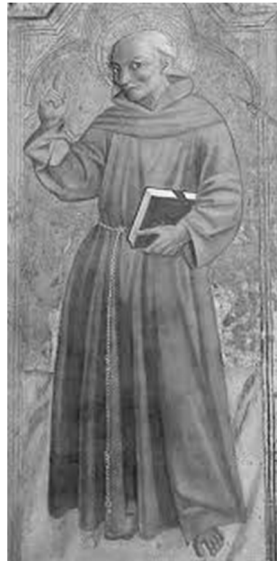
Bernhardin von Siena 1380-1444